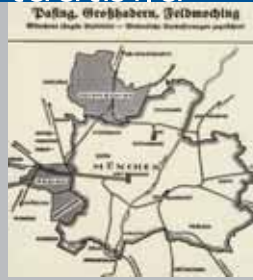
Eingemeindungsplan 1938; zu München gehören jetzt: Pasing, Großhadern und Feldmoching Münchener Stadtbau von 20.3.1938